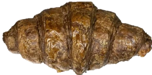
ลักษณะปกติหลังจากอุ่นสินค้า