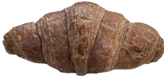
พบฟองอากาศบนผิวหน้าสินค้า แต่ไม่แตก ซึ่งเป็นลักษณะปกติของสินค้า

เนื่องจากการจัดเก็บสินค้าที่สภาวะแห้งแข็ง อาจทำให้ผิวสินค้าต่าง แต่จะหายไปหลังทำละลาย