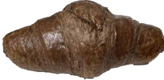
พบน้ำฉีก/จอย/ระยะห่างของผิวครีวของต์ชั้นกลางจากขอบ เกิน 3 ซม.

5. ลักษณะที่ ไม่สามารถยอมรับได้ (Rejected) (ต่อ)