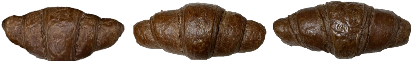
ลักษณะปกติและจำนวนชั้นของครีวของตัดาร์ก 5-7 ชั้น