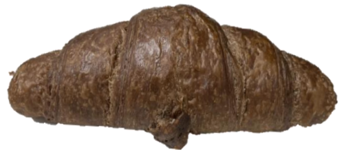
พบปลายครีวของต์ยื่นออกนอกตัวครีวของต์