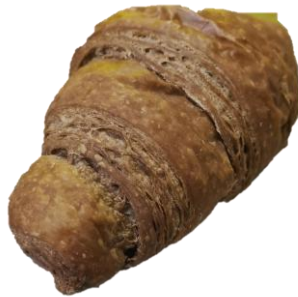
ครีวของต์มีลักษณะเป็น โปรง