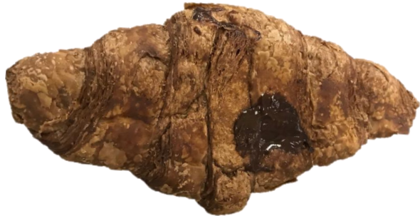
พบ ใส้ช็อกโกแลตเลอะ/เปื้อน/ทะลักที่ฐานครีวของต์มาก